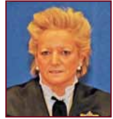
Mª Luisa Segoviano Astaburuaga Magistrada sala IV del Tribunal Supremo