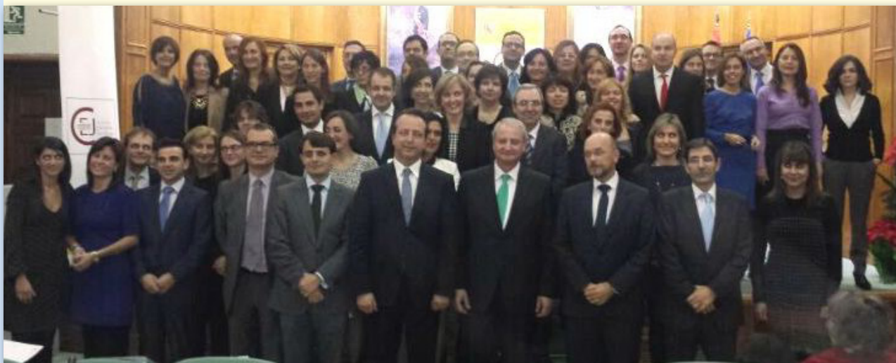
Autoridades y miembros de la 39ª promoción interna de secretarios judiciales

Actualmente se está llevando a cabo el ejercicio oral para los aspirantes de promoción interna que aprobaron el primer ejercicio y una vez termine promoción interna, se comenzará con los aspirantes de turno libre que hayan aprobado el primer ejercicio celebrado el pasado 25 de enero.