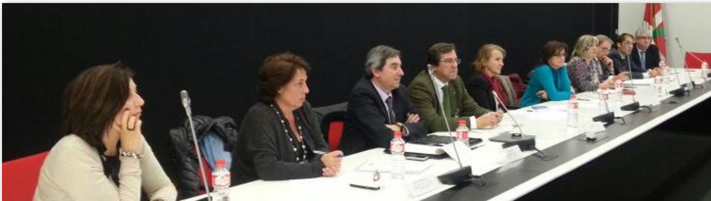
Momento de la reunión de la Comisión Permanente del CTEAJE

Liderado por Aragón. Participan otras tres comunidades y el Ministerio de Justicia. Se está trabajando en una recomendación general válida para todo el territorio nacional acerca de la infraestructura técnica.