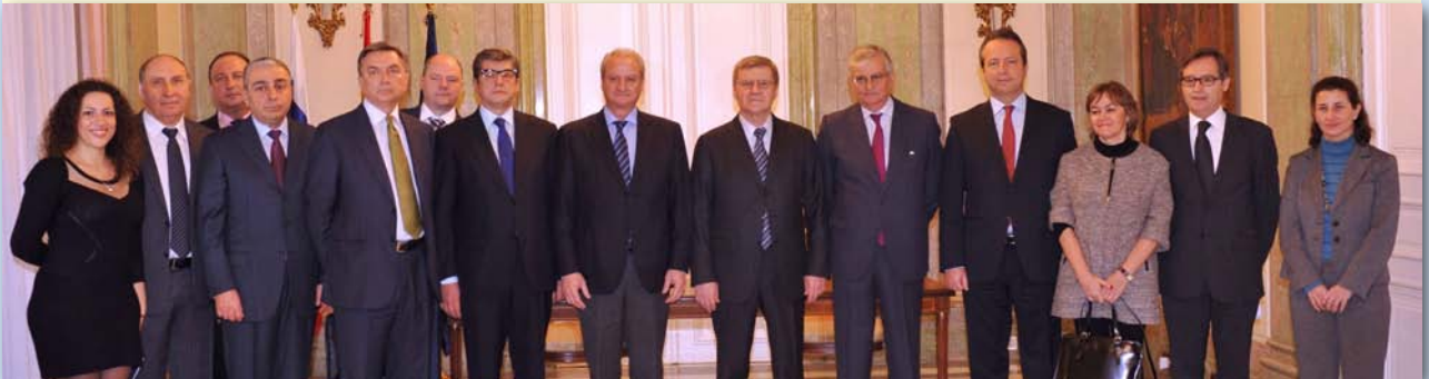
El secretario de Estado de Justicia, el fiscal general del Estado y el secretario general de la Administración de Justicia, con la delegación rusa

de 2013, un encuentro entre representantes del Ministerio de Justicia de España y de la Fiscalía General del Estado, con representantes de la Fiscalía General de la Federación Rusa, encabezados por el fiscal general, Yuri Chaika. Al término de la visita se firmó un memorando de entendimiento llamado a fortalecer la colaboración hispano-rusa en la lucha contra la criminalidad.