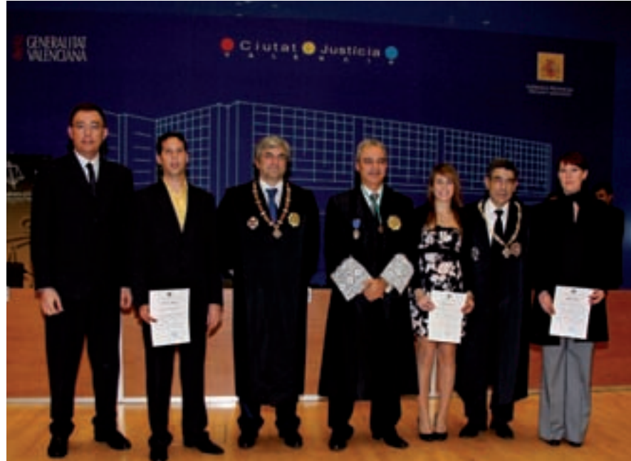
Premio Extraordinario concedido a los Estudiantes