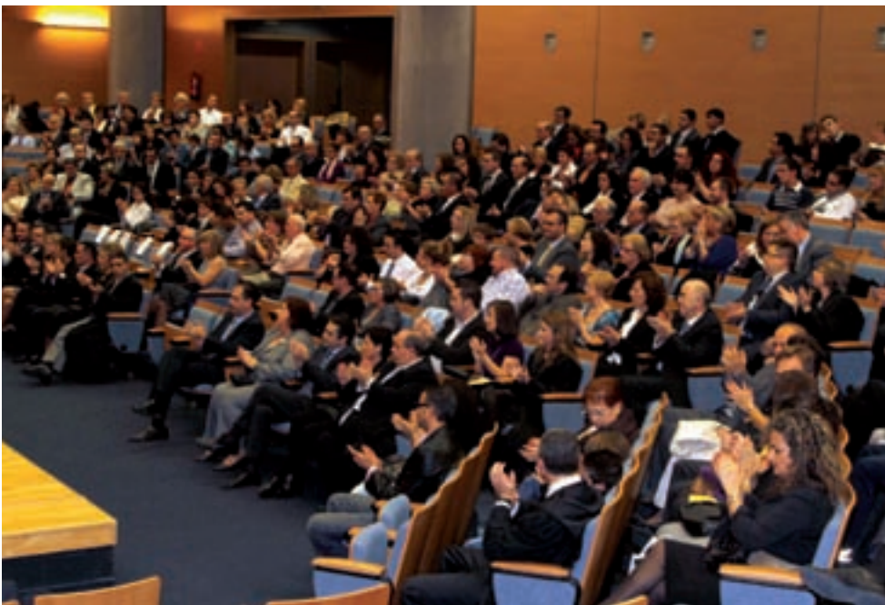
Salón de Actos de la Ciudad de la Justicia