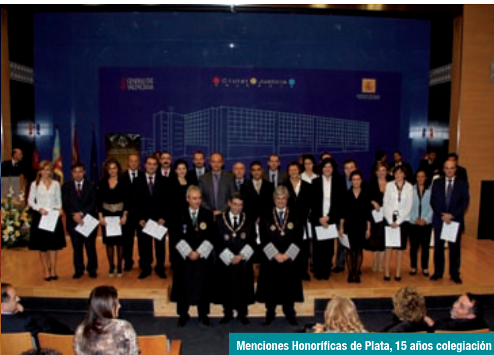
Menciones Honoríficas de Plata, 15 años colegiación