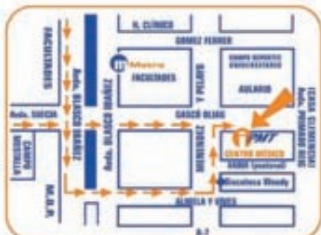
Para más información visita nuestra web