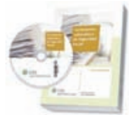
Formularios Laborales y de Seguridad Social.