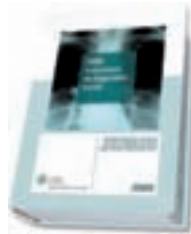
2000 Soluciones de Seguridad Social 2009.

Agradecemos a Editorial CISS la mencionada y estimada donación.