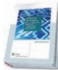
La factura electrónica y otras obligaciones telemáticas de empresarios y profesionales.