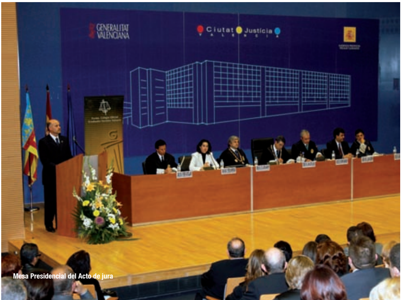
Mesa Presidencial del Acto de jura

El Colegio Oficial de Graduados Sociales de Valencia llevó a cabo el pasado 20 de noviembre los tradicionales Actos Institucionales.