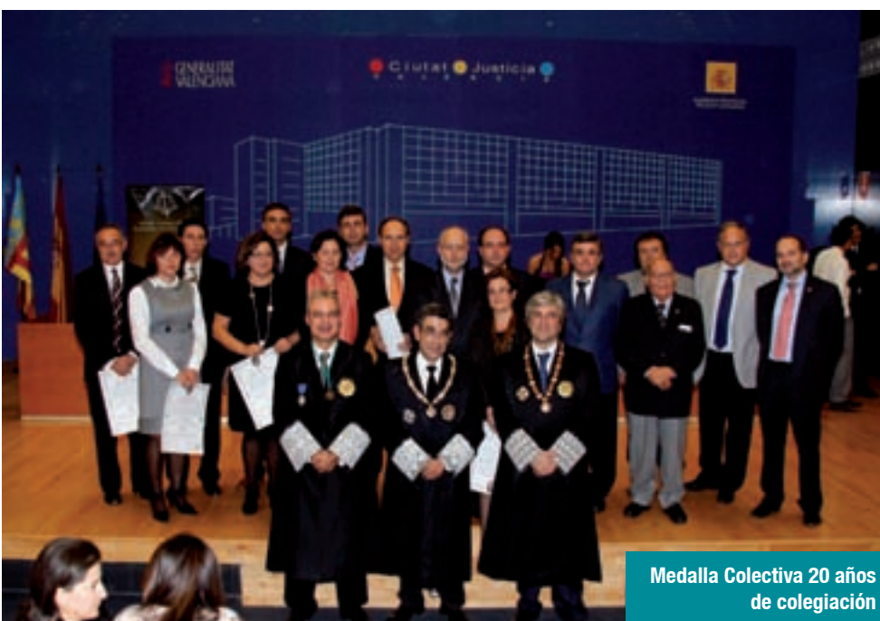
Medalla Colectiva 20 años de colegiación