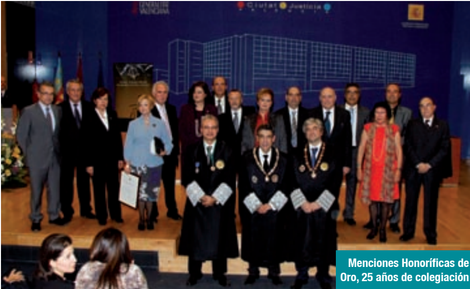
Menciones Honoríficas de Oro, 25 años de colegiación