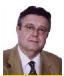
Por ANDRÉS GONZÁLEZ FERNÁNDEZ Graduado Social. Socio Director AG&AG Bufete Laboralista Director Escuela Superior Estudios Laborales.

El día 11 de julio de 2006 se dictó sentencia del citado Tribunal de Justicia (Gran Sala) en la que a la primera cuestión se establece que una persona despedida por su empresario exclusivamente a causa de una enfermedad no está incluida en el marco general establecido en la Directiva 2000/78 para la lucha contra la discriminación, y —a su vez— que la prohibición en materia de despido de la discriminación por motivos de discapacidad recogida en la Directiva 2000/78, se opone a un despido por motivos de discapacidad que no se justifique por el hecho de que la persona en cuestión no sea competente o no esté capacitada o disponible para el desempeño de sus tareas.