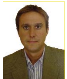
Por ANDRÉS GONZÁLEZ RAYO Graduado Social. Socio Consultor AG&AG Bufete Laboralista.

En cuanto a la segunda cuestión, se señala que la enfermedad en cuanto a tal no se puede considerar un motivo que venga a añadirse a aquellos otros motivos en relación con los cuales la Directiva 2000/78 prohíbe toda discriminación.