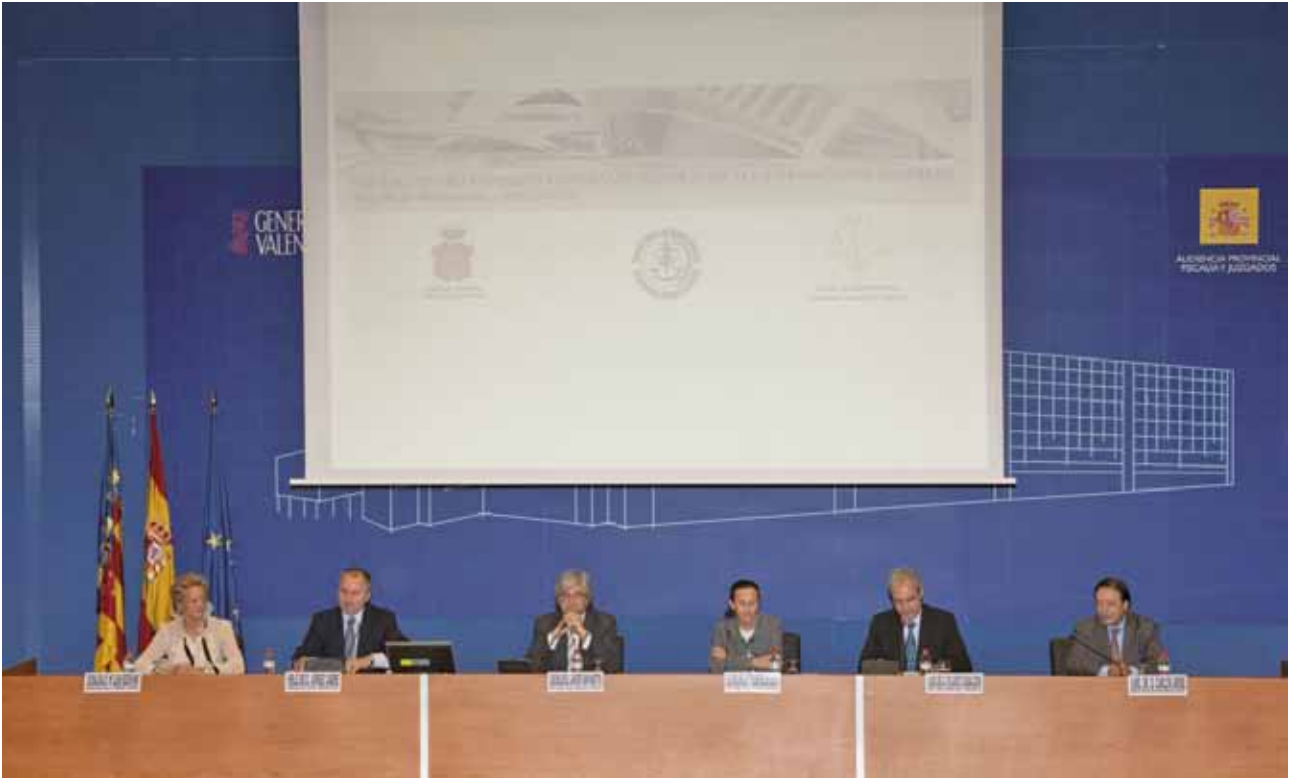
■ Mesa Inaugural