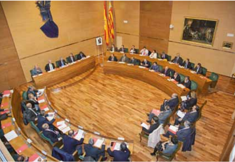
■ Pleno Consejo General en el Salón de Plenos de la Diputación de Valencia

El pasado 17 de noviembre en el Palacio de la Diputación de Valencia se celebró sesión plenaria donde se acordaron importantes puntos del orden del día. Asimismo se realizó el escrutinio de las votaciones a los cargos de Vicepresidente 1º, Vocales Electivos Ejercientes y Vocal Electivo No Ejerciente.