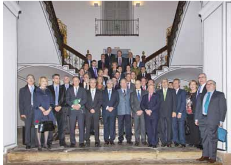
■ Palau de Battia. Escalinata

El resultado del escrutinio de los votos para la renovación de la composición de la Comisión Permanente fue el siguiente: