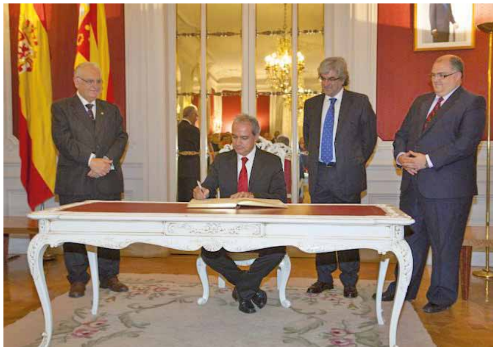
■ Firma del Presidente en el Libro de Honor de las Cortes Valencianes, en nombre de todos los colegiados de Valencia