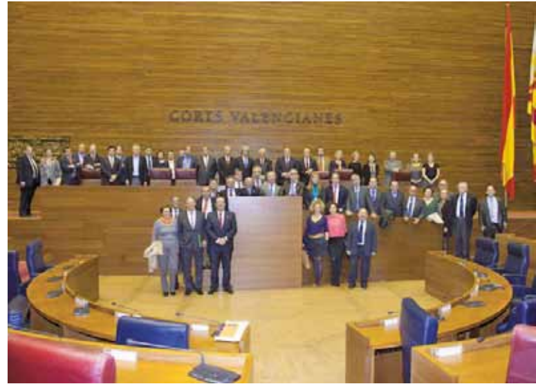
■ Visita Institucional Corts Valencianes

Paralelamente a las conferencias técnicas, han tenido lugar varias recepciones Institucionales, el President de la Generalitat Alberto Fabra el mismo jueves día 15 de noviembre, en el Palau de la Generalitat, ofreció una recepción a los miembros del Consejo General.