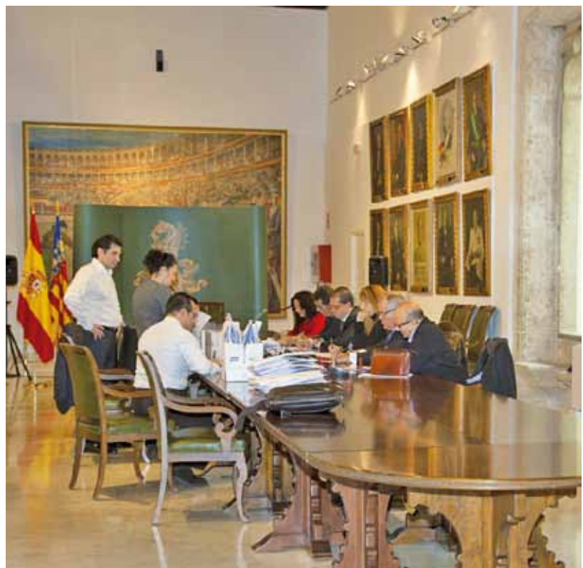
■ Salón de Reinas, escrutinio votos