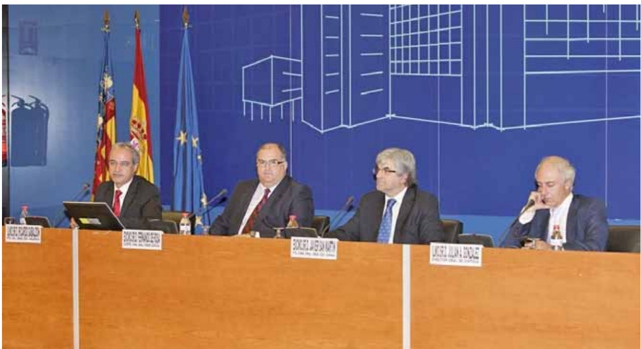
■ Mesa conferencia clausura