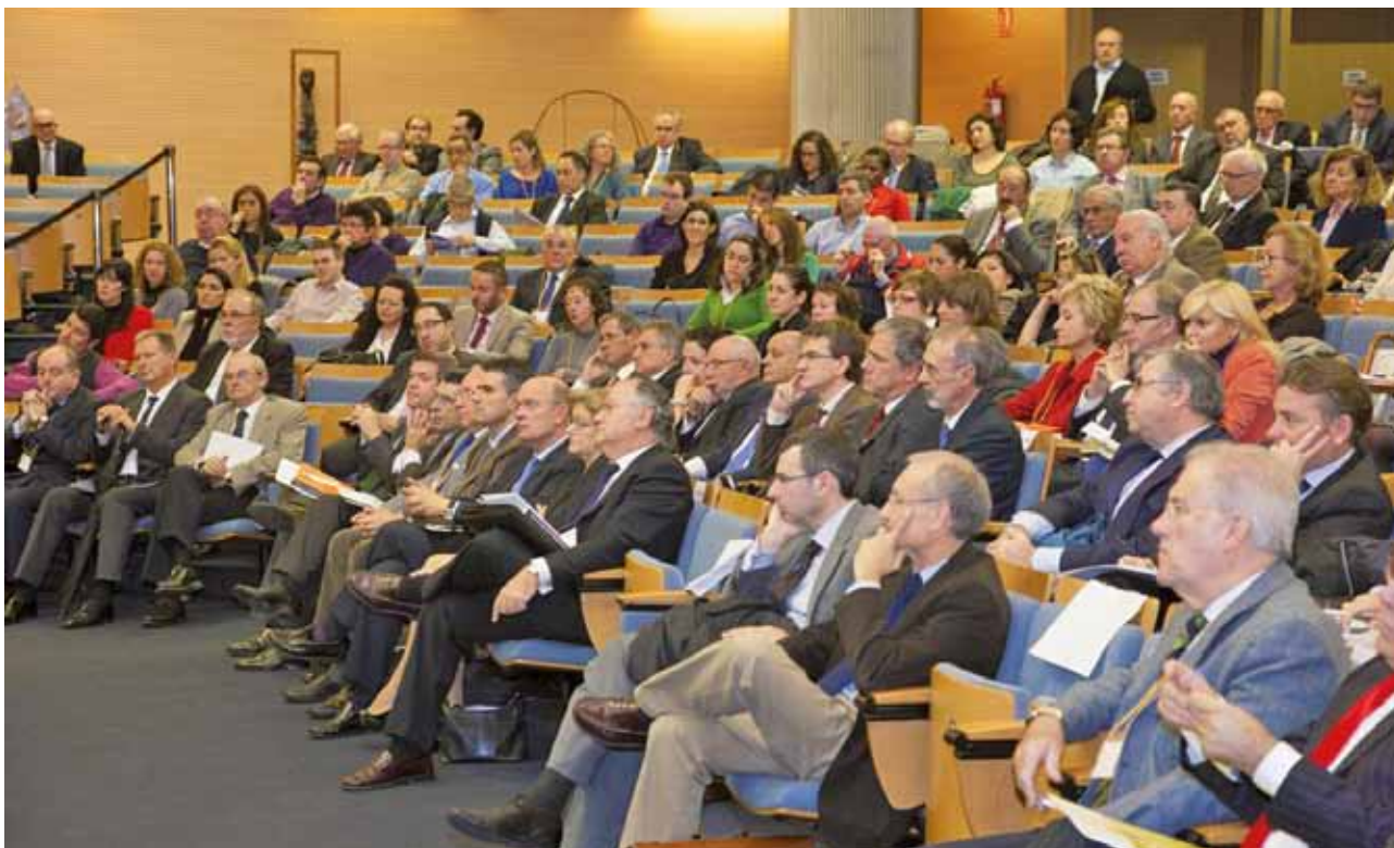
■ Asistentes al Encuentro

rar productividad y vayan por la senda del crecimiento, aunque también pienso que es una ley que ha llegado tarde, si se hubiera aprobado hace cuatro o cinco años hubiera generado menos trauma que ahora”.