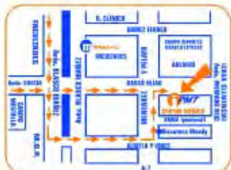
Para más información visita nuestra web