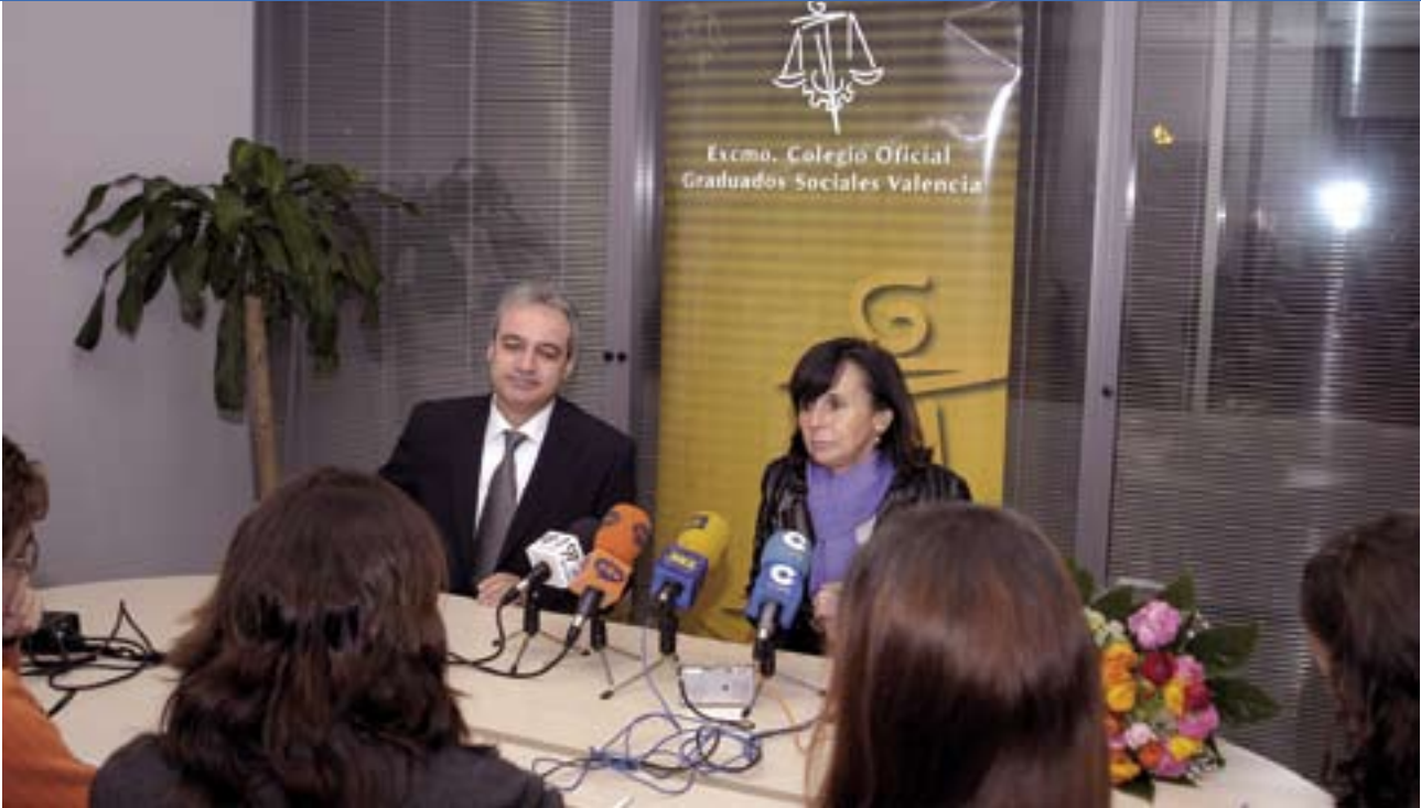
Rueda de prensa en la sede del Colegio, en la Ciudad de la Justicia