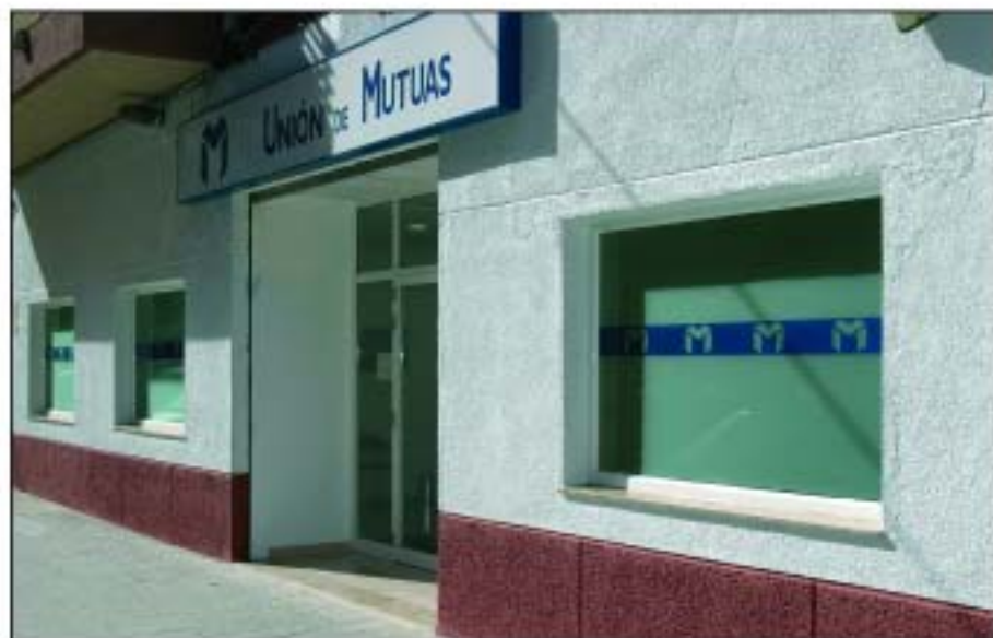
El nuevo centro asistencial cuenta con una superficie de 400 m 2 y se ubica en la C/ Perú de Gandía.

Unión de Mutuas, en su afán por prestar el mejor servicio a los empresarios mutualistas de la comarca de La Safor, ha inaugurado un nuevo centro asistencial en Gandía que viene a sustituir al que, desde hace más de diez años, venía funcionando en el Centro de Servicios Integrados del Ayuntamiento de Gandía en el Polígono Industrial Alcodar.