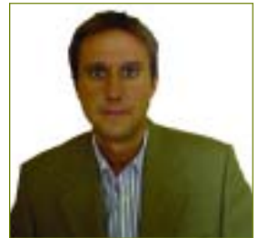
■ Por ANDRÉS GONZÁLEZ RAYO. GRADUADO SOCIAL NÚM. 4231.

Para centrar el tema tratado de forma resumida, podemos decir que la cuestión planteada, en orden a determinar la responsabilidad empresarial sobre las prestaciones cuando existen descubiertos de cotización a la Seguridad Social, parte de la normativa establecida en la Ley General de la Seguridad Social, art. 126.2, en el que se determina que el incumplimiento de las obligaciones en materia de afiliación, altas y bajas y de cotización determinará la exigencia de responsabilidad, en cuanto al pago de las prestaciones, previa la fijación de los supuestos de imputación y de su alcance y la regulación del procedimiento para hacerla efectiva, -fijación de supuestos y de su alcance y del procedimiento que no se ha producido aún-; de la normativa establecida en la Ley Articulada de la Seguridad Social, que mantiene su vigencia con rango reglamentario, art. 94.2b), que determina que el empresario responderá de las prestaciones causadas por falta de ingreso de las cotizaciones a partir de la iniciación del segundo mes siguiente a la fecha en que expire el plazo reglamentario establecido para pago, y que las cotizaciones efectuadas fuera del plazo ... no exonerarán de responsabilidad, y el art. 95.4, que señala que podrá moderarse reglamentariamente el alcance de la responsabilidad empresarial cuando el empresario ingrese las cuotas correspondientes a la totalidad de sus trabajadores.