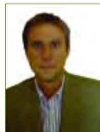
Por ANDRÉS GONZÁLEZ RAYO Graduado Social núm. 4231

de normativa específica en ese sentido el plazo será de tres meses, tanto en los procedimientos iniciados de oficio, como en los iniciados a solicitud del interesado.