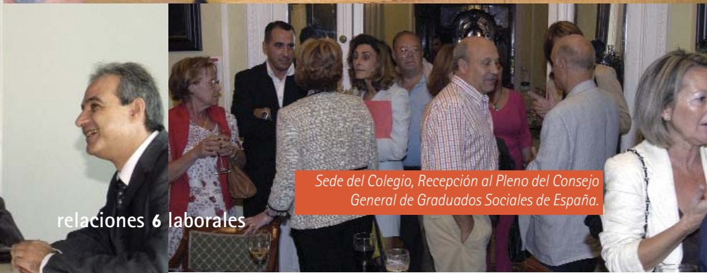
Sede del Colegio, Recepción al Pleno del Consejo General de Graduados Sociales de España.