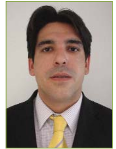
Por OSCAR MARTORELL TRONCHONI GRUADO SOCIAL N° 4165

Debemos de recordar que la subsistencia y el potencial de una empresa dependen de muchos factores, que algunos son internos, y otros ajenos a ellas. Por tanto y teniendo en cuenta que los que gestionan, dirigen y producen en las empresas son personas, en la medida que nos sea posible debemos de valorar ese trabajo, esa calidad, en pocas palabras, el rendimiento que está "dando" el empleado ajustándolo a las necesidades y/o objetivos de la empresa. INTENTAR DESCUBRIR EN QUE SE ESTÁ FALLANDO, NO ES SINÓNIMO DE CULPABILIDAD SINO DE EFICACIA PARA ALCANZAR OBJETIVOS DISEÑADOS EN EL PLAN ESTRATÉGICO.