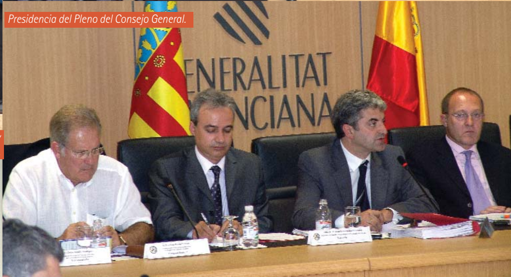
Presidencia del Pleno del Consejo General.