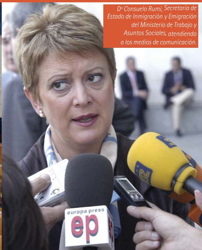
Dña. Consuelo Rumi, Secretaria de Estado de Inmigración y Emigración del Ministerio de Trabajo y Asuntos Sociales, atendiendo a los medios de comunicación.