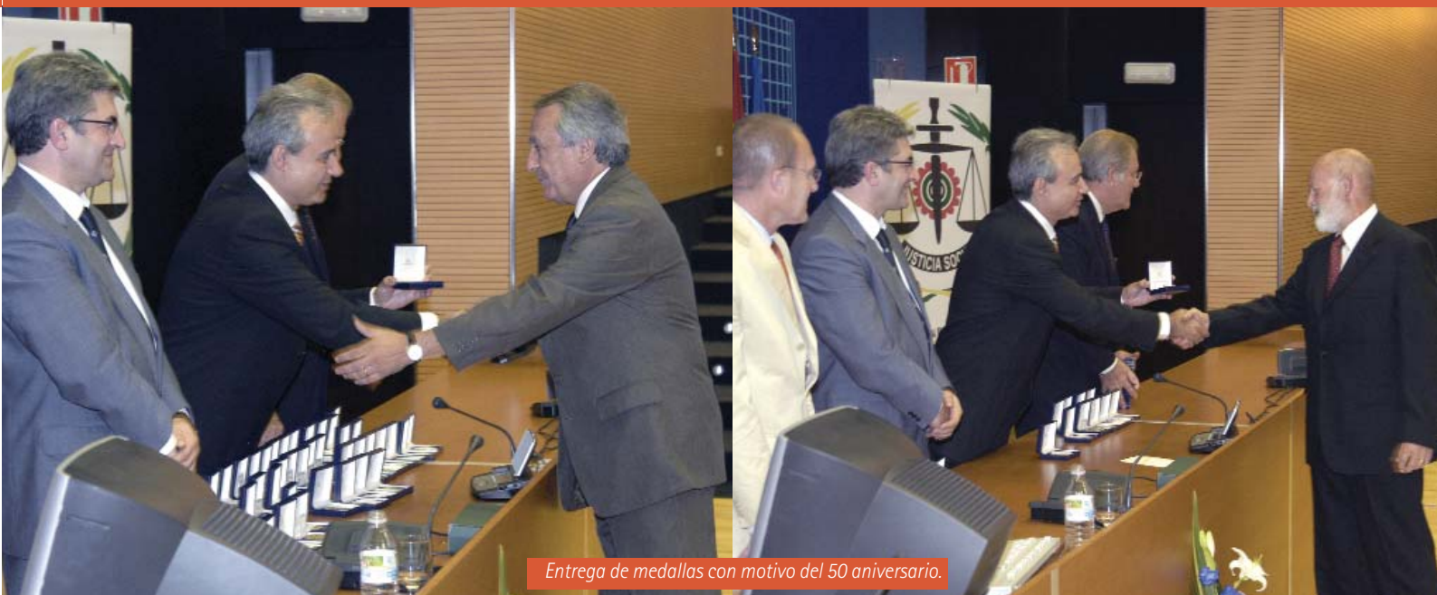
Entrega de medallas con motivo del 50 aniversario.