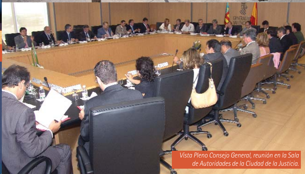
Vista Pleno Consejo General, reunión en la Sala de Autoridades de la Ciudad de la Justicia.