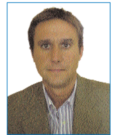
Por ANDRÉS GONZÁLEZ RAYO Graduado Social núm. 4321

A continuación extractamos algunos fragmentos de la sentencia: